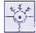
Società Italiana Neurologia Pediatrica Sezione Umbria Marche