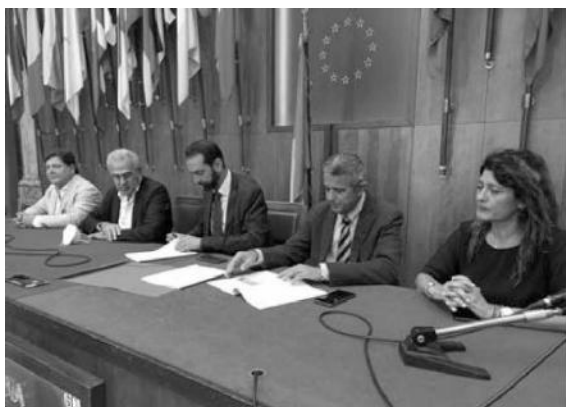
Un momento della conferenza

Ritaglio Stampa ad uso esclusivo del destinatario. Non riproducibile