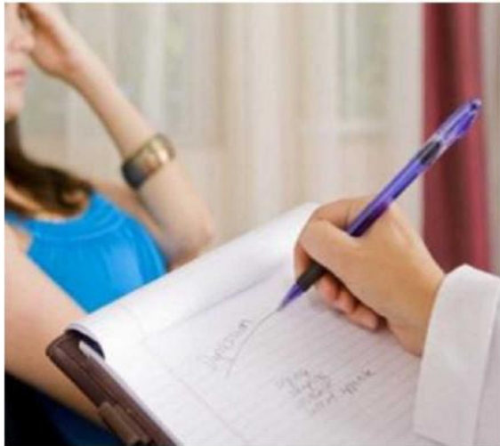
Ansia, insicurezza, problemi relazionali; nelle scuole c'è uno sportello

Agli sportelli attivati da Civitas negli istituti si sono rivolti 619 studenti: un forte aumento. Ansia, problemi relazionali, disturbi alimentari e nei casi più seri anche l'autolesionismo