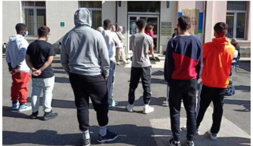
Per gli studenti della Valtrompia è ora certificata una necessità sempre più diffusa di sostegno psicologico