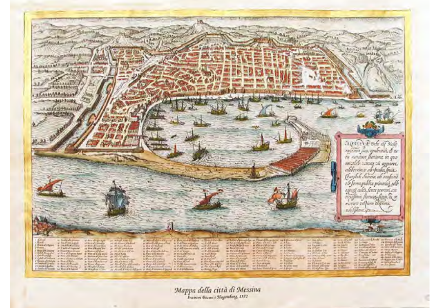
Mappa della città di Messina Incisa da Giovanni Battista Piranesi, 1772

Palazzo dei Congressi AOU Policlinico Universitario - Messina 2 - 3 Dicembre 2011